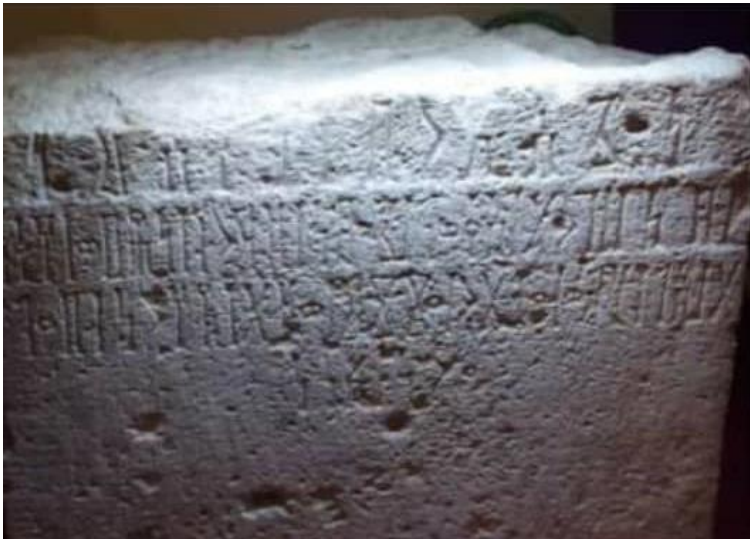
لوحة (٤) (الناشري، القيلي جبل كنن ١)