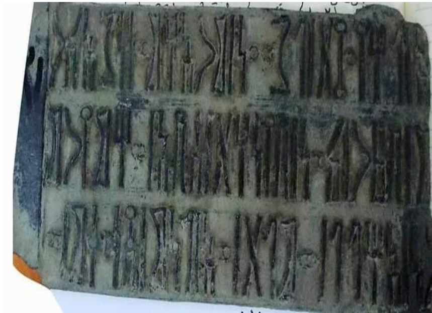
لوحة رقم (٧) النقش (الناشري، القيلي جبل كنن 4)