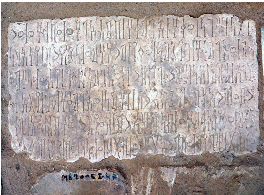
لوحة رقم (٨) القيلي - محرم بلقيس ١٢