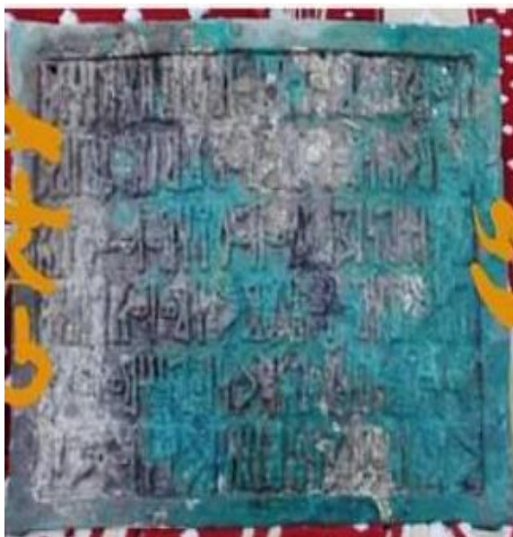
لوحه رقم (٦) النقش (الناشري، القبلي جبل كنن ٣)