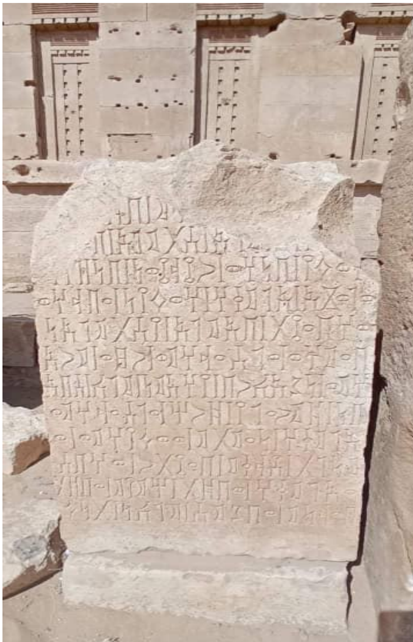
لوحة رقم (٩) إرياني ٢ = القيلي - محرم بلقيس ١٣