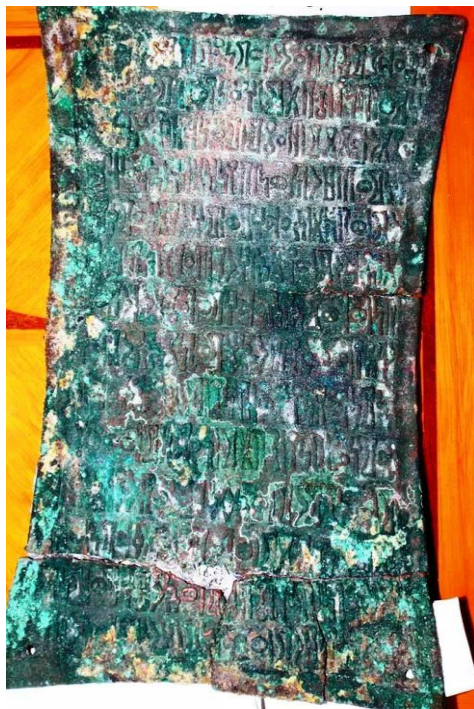
الوحة رقم (٥) (الناشري، القبلي جبل كنن ٢)