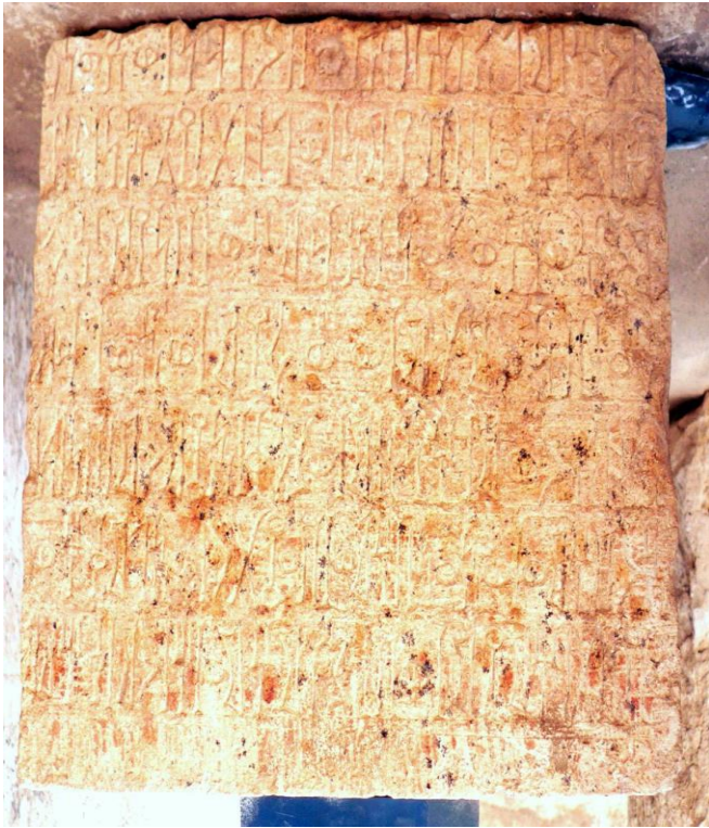
لوحة (٣) القيلي محرم بلقيس ١١